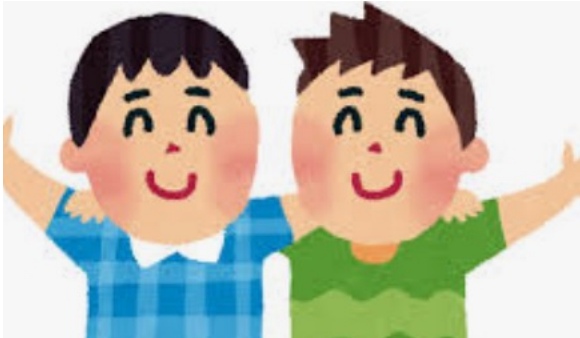
© source unknown. All rights reserved. This content is excluded from our Creative Commons license. For more information, see https://ocw.mit.edu/help/faq-fair-use/