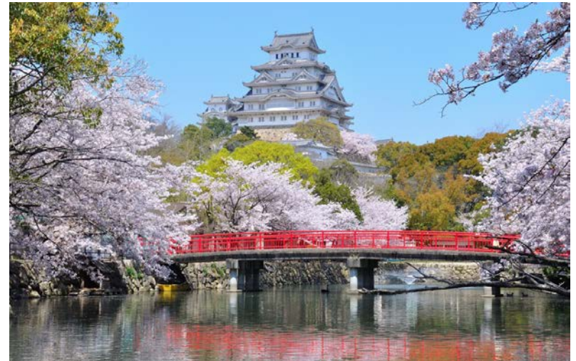
© Japan-Zone.com. All rights reserved. This content is excluded from our Creative Commons license. For more information, see https://ocw.mit.edu/help/faq-fair-use/