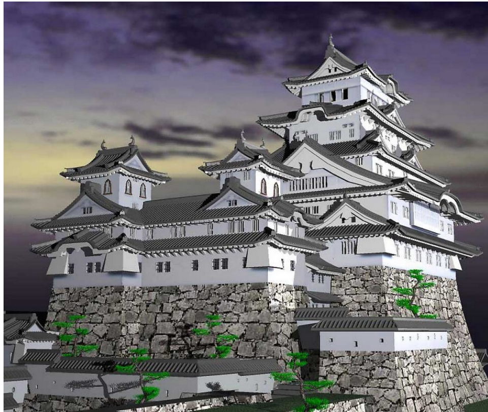
© 3Dの世界. All rights reserved. This content is excluded from our Creative Commons license. For more information, see https://ocw.mit.edu/help/faq-fair-use/